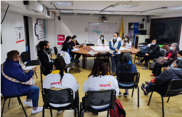
Diálogo Territorial barrio Restrepo Occidental