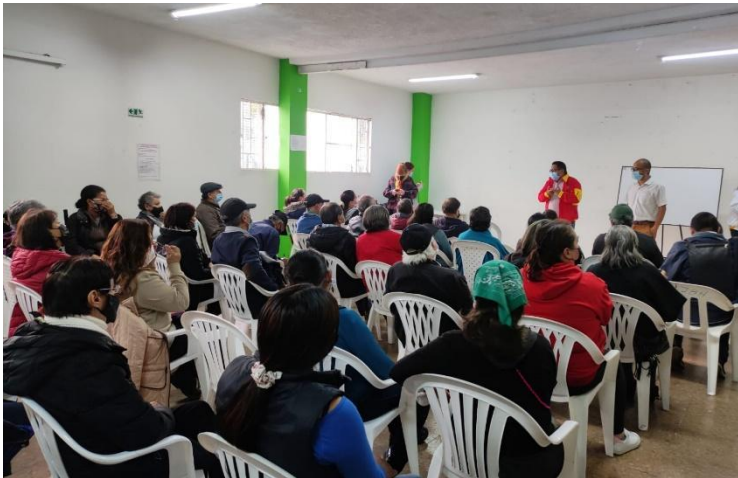
Inserte una imagen de un diálogo y cita