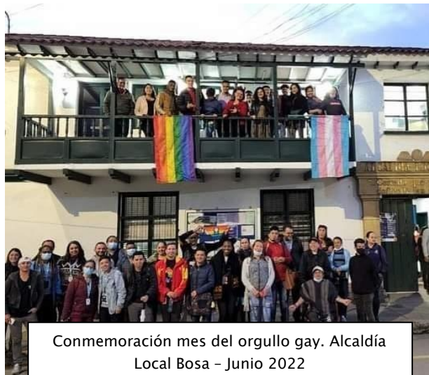
Commemoración mes del orgullo gay. Alcaldía Local Bosa - Junio 2022

Según la Caracterización de sectores sociales LGBTI de la Dirección de Diversidad Sexual de Bogotá, De las personas mayores de 18 años de la localidad, el 2,6% se declaró homosexual (16.266 personas), el 0,1% bisexual (379), el 64,7% heterosexuales (405.595) y el 0,1% no sabe o no responde (907). También, se encontró que el 50,9% de los hombres y el 29,8% de las mujeres homosexuales son jefes de hogar, y el 100% de la población bisexual se identifica como hijos o hijastros. Igualmente, el 50,1% de las personas bisexuales y el 8,9% de las personas homosexuales se encontraban estudiando. Entre las razones por las que no se encontraban estudiando resalta la necesidad de trabajar o buscar trabajo y la falta de dinero (Secretaría Distrital de Planeación, 2017).