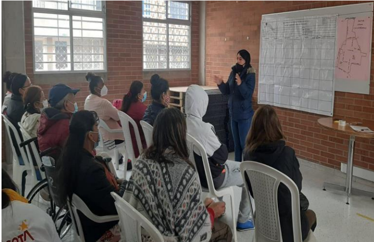
Diálogo Territorial Gran Colombiano, Bosa – Abril 19 de 2022