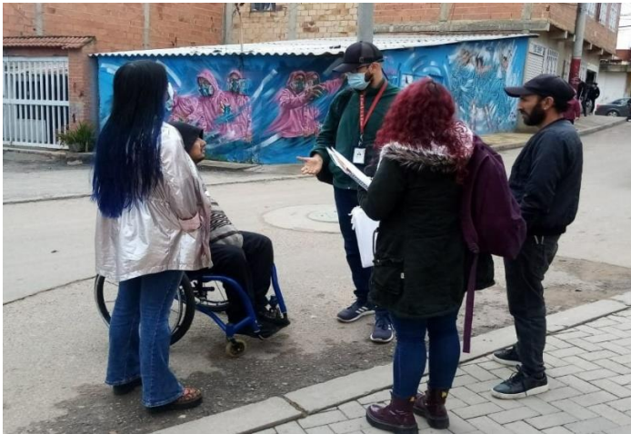
Conversación preparatoria con comunidad de Bella Flor-Ciudad Bolívar.