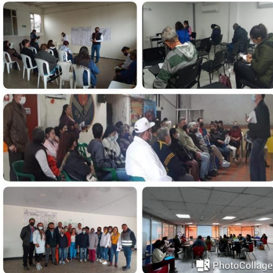
Diálogos territoriales vigencia 2022