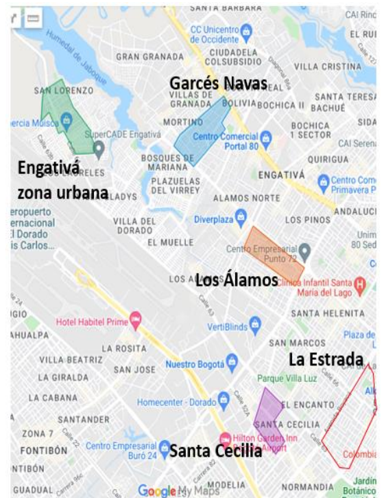
Territorios caracterizados vigencia 2

Así mismo, tiene las siguientes nueve Unidades de Planeamiento Zonal (UPZ): Las Ferias, Minuto de Dios, Boyacá Real, Santa Cecilia, Bolivia, Garcés Navas, Engativá, Jardín Botánico y Álamos. En cuanto al uso del suelo predomina el residencial (52,6%), seguido por el de servicios (16,1%), el comercial (13,6%) y el dotacional (12,8%) 2 De las 9 UPZ con que cuenta Engativá una es