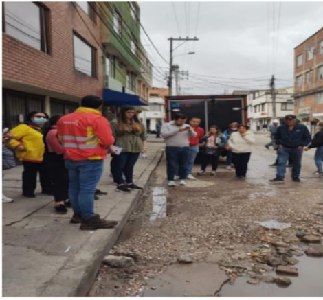
Figura 7: Recorrido Barrio Santa Cecilia.