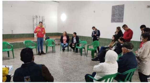
Figura 8: Dialogo lideres Barrio Santa Cecilia.

Para el caso del barrio Fontibón Centro, se evidenció que existe cierta tensión, entre dos grupos de líderes comunitarios, debido a conflictos anteriores en los procesos comunitarios de su barrio; por tal motivo, en este territorio se desarrollaron dos diálogos, uno con cada grupo. En este ejercicio se identificaron similitudes en la expresión de problemáticas y necesidades que son importantes para los dos; pero también se identificó que tienen diferentes perspectivas territoriales, por lo que el ejercicio resulto ser enriquecedor.