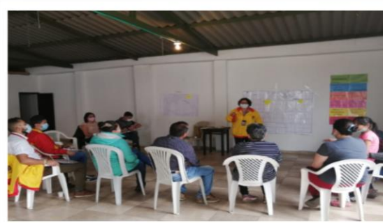
Figura 5: Mapa de emociones barrió el Chircal.