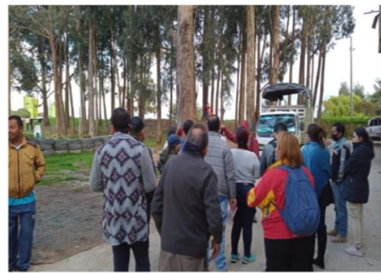
Figura 3: Cambuche barrió el Chanco Rural III. Figura 4: Recorrido ronda hídrica barrió el chanco rural III.

En el barrio Fontibón Centro, se identificó en las peluquerías y barberías cercanas al parque Fundacional, población de especial protección perteneciente a los sectores LGBTI, durante los diálogos sociales adelantados la comunidad no refirió casos de violencia o problemáticas asociadas, no obstante, a través del proyecto de la SDIS “Compromiso Social por la Diversidad” se han activado los servicios y rutas disponibles, por posibles casos de discriminación en algunas entidades públicas y privadas.