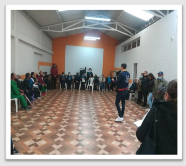
Figura 1: Dialogo San José de Fontibón. 10 de mayo de 2022.