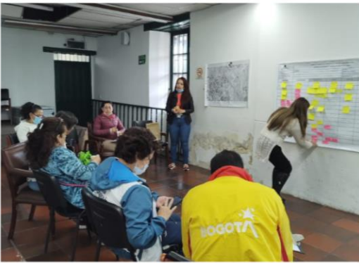
Figura 9: Dialogo Barrio Fontibón Centro

Para el caso del barrio Fontibón Centro, se evidenció que existe cierta tensión, entre dos grupos de líderes comunitarios, debido a conflictos anteriores en los procesos comunitarios de su barrio; por tal motivo, en este territorio se desarrollaron dos diálogos, uno con cada grupo. En este ejercicio se identificaron similitudes en la expresión de problemáticas y necesidades que son importantes para los dos; pero también se identificó que tienen diferentes perspectivas territoriales, por lo que el ejercicio resulto ser enriquecedor.