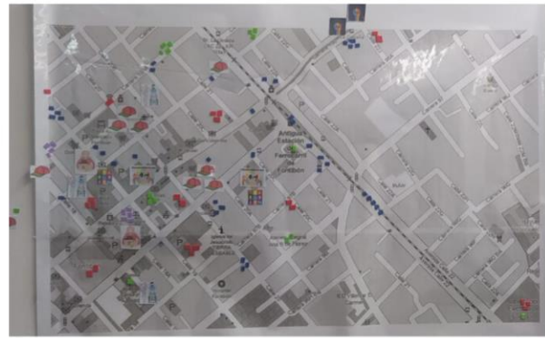
Figura 10: Mapeo de las emociones Barrio Fontibón Centro.