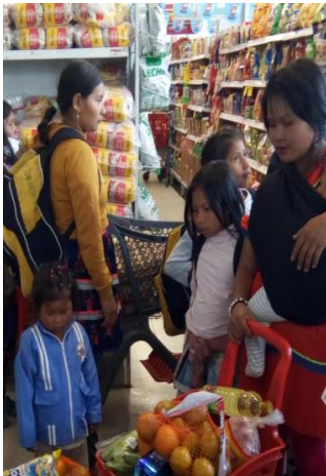
Canje de bonos de población Emberá, mayo 2022.

BOGOTÁ, 21 DE JULIO DE 2022 • NÚMERO 01 •