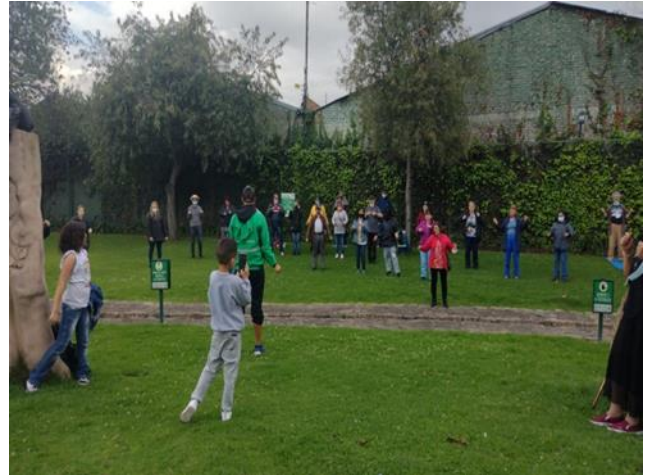
Yoga al Natural con personas mayores cuidadoras de Centro Día Mi Refugio, mayo 06 2022, Parque el Renacimiento, en articulación con Jardín Botánico.

La Manzana del Cuidado Los Mártires ubicada en los territorios de los barrios Santa Fe, La Favorita y Samper Mendoza se configura merced a la identificación de una alta presencia de personas cuidadoras, con orientaciones sexuales e identidades de género diversas, que en alto porcentaje realizan actividades sexuales pagadas; estas características suman pérdida de oportunidades a las cuidadoras, en tanto mantienen condiciones que las excluyen de los servicios distritales, especialmente a la oferta educativa y de salud. La articulación intersectorial que se ha realizado en lo corrido de 2022 a través de la Mesa Local de Manzana del Cuidado, ha permitido avanzar de manera significativa en la vinculación de cuidadoras vinculadas a los servicios de la SDIS, a los programas de educación flexible que se adelantan en El Castillo de las Artes, así mismo en su participación en actividades de respiro, jornadas de auto cuidado y aprovechamiento del tiempo libre, así como acciones formativas que propenden por la transformación cultural hacia la equidad de género.