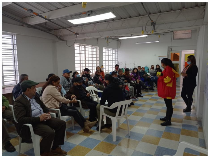
Dialogo territorial Barrio El Vergel.