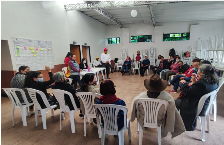
Diálogo Territorial barrio San Rafael