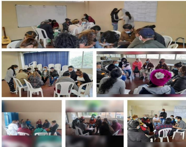
Ilustración 1 Diálogos Territoriales