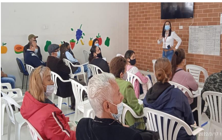
Inserte una imagen de un diálogo y cítela