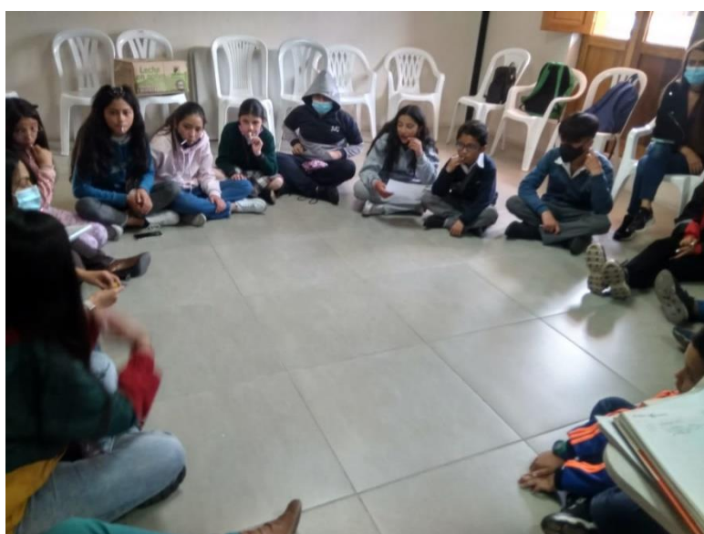
Fotografías de la sesión