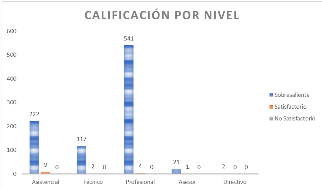
Grafica 3. Calificación por nivel

En el gráfico 3 se puede apreciar que el 96.1% de los evaluados del nivel asistencial se encuentran en el rango sobresaliente, a su vez el 98.3% pertenecen al nivel técnico, el 99.3% pertenece al nivel profesional, el 95.5% pertenecen al nivel asesor y el 100% perteneciente al nivel directivo.