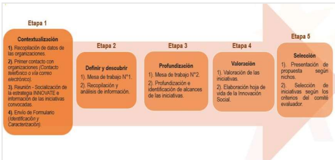
Ilustración 1. Metodología para la identificación y caracterización de iniciativas