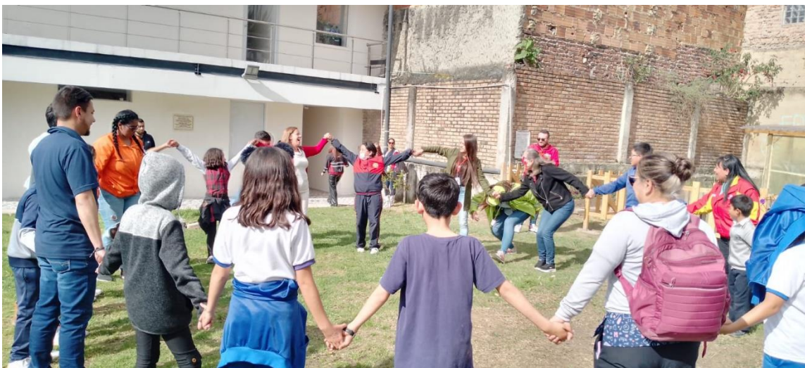
Fotografías de la sesión.

Tratamiento de datos personales: Los datos personales aquí consignados tienen carácter confidencial, razón por la cual es un deber y un compromiso de los asistentes y de la SDIS no divulgar información alguna en propósito diferente a la de este registro so pena de las sanciones legales a que haya lugar de acuerdo con la Ley 1581 de 2012 y Decreto 1377 de 2013.