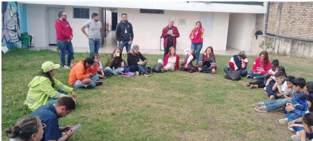
Fotografías de la sesión