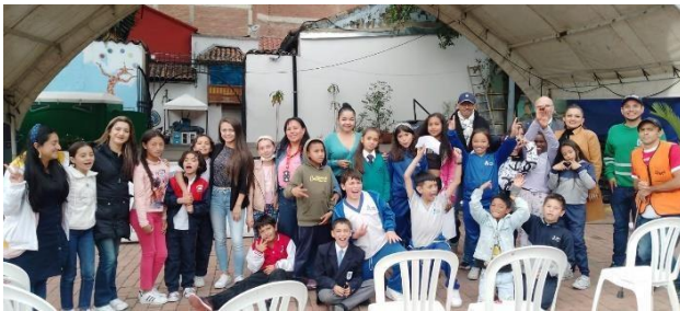
Fotografías de la sesión.