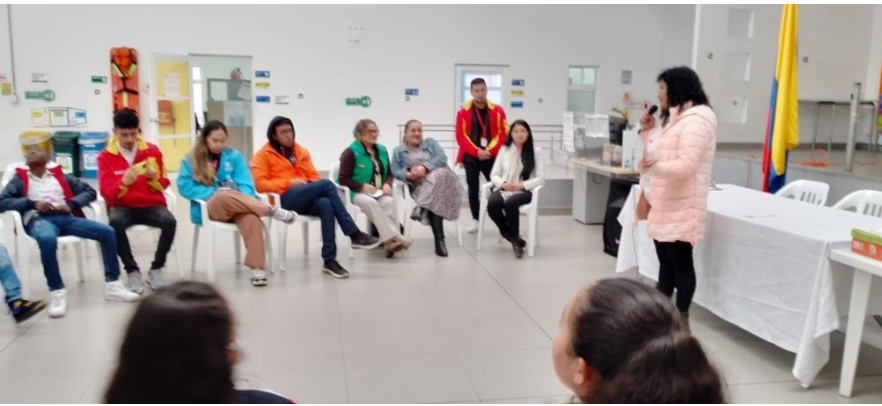
Fotografías de la sesión.

Tratamiento de datos personales: Los datos personales aquí consignados tienen carácter confidencial, razón por la cual es un deber y un compromiso de los asistentes y de la SDIS no divulgar información alguna en propósito diferente a la de este registro so pena de las sanciones legales a que haya lugar de acuerdo con la Ley 1581 de 2012 y Decreto 1377 de 2013.