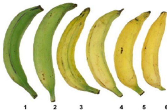
Grado de Maduración Plátano – Subdirección de Abastecimiento.

Finalmente, frente al producto plátano es importante mencionar que la Ficha Técnica del Producto (FTP) establece, en los requisitos específicos, un grado de maduración del plátano hartón maduro de "color de cáscara verde – amarillo – verde", clasificado entre los grados 2 y 3, como se evidencia en la siguiente imagen: