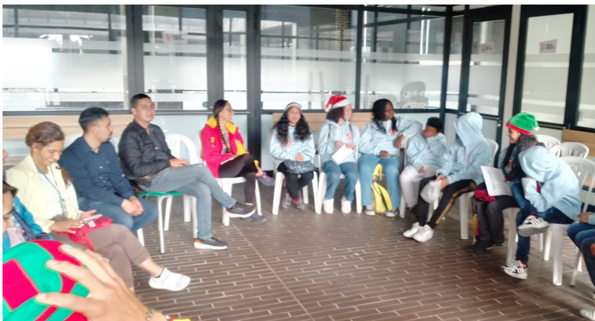
Fotografías de la sesión

SCRD/DALP. Frente a la Problemática de Persecución de falta de Seguridad en Parques y Falta de espacios seguros para los NNA; el sector cultura y deporte podría aportar dando a conocer la oferta de las diferentes entidades del sector, en la cual contamos con lugares seguros como CREAS, Bibliotecas, PPP, escuelas deportivas.