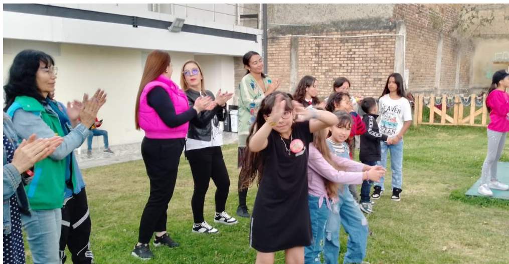
Fotografías de la sesión

* Consumo SPA parques. - Idipron → Estrategia territorial - Comités relogado - Calle - Prevenciones - Esna - Secretario de cultura Idartes → Dinamizar espacio mediante articulación con artistas de calle (cantantes, pintores, muralistas, comediantes) * Inseguridad - Alcaldía local - Gestores, realizan frentes de seguridad en puntos focales de inseguridad. - Habitat "Calle Mágica" → Estrategia de embellecimiento de los parques y espacios públicos con niños y niñas. → Bienestar Animal y ambiental. - Denuncia de casos de maltrato animal. - Jornadas de adopción.