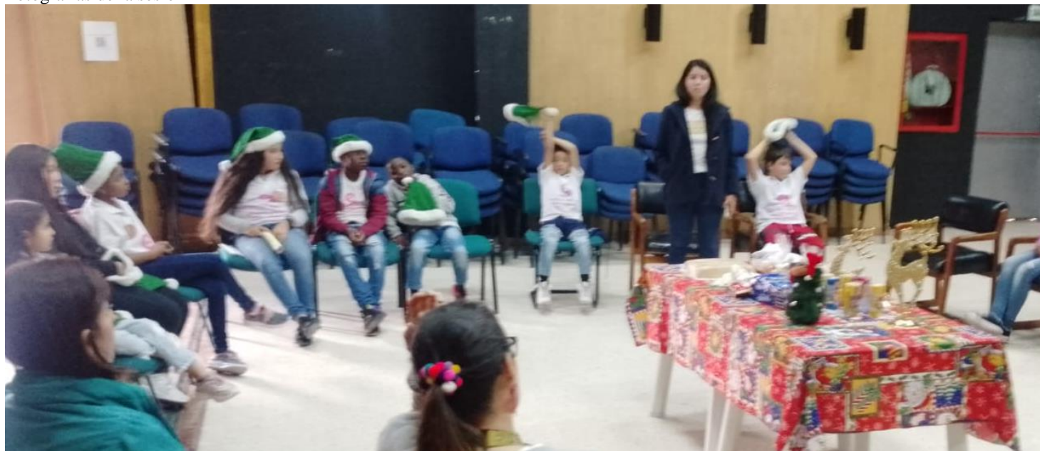
Fotografías de la sesión