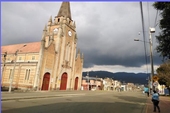
Iglesia de San Fernando.