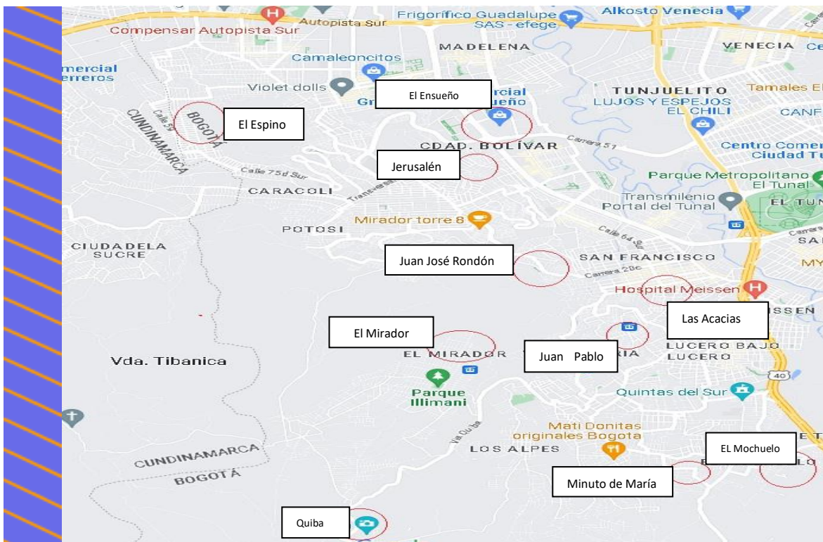
Mapa de la Localidad de Ciudad Bolívar con la identificación de los territorios caracterizados.

El ejercicio de caracterización se basó en la realización de diálogos territoriales exploratorios, los cuales tuvieron por objeto la recolección de experiencias y sucesos del territorio, desde la visión de los mismos habitantes del sector, así como las necesidades y los riesgos a los cuales se exponen. En dichos conversatorios se buscó la participación de líderes y lideresas de los territorios, intentando siempre resaltar la voz y opinión de las mujeres y jóvenes como grupos poblacionales de especial interés en la configuración y modo de vivir de la Localidad de Ciudad Bolívar. En el caso del abordaje del territorio de Quiba fue posible la articulación interinstitucional con la Secretaria Distrital de Salud.