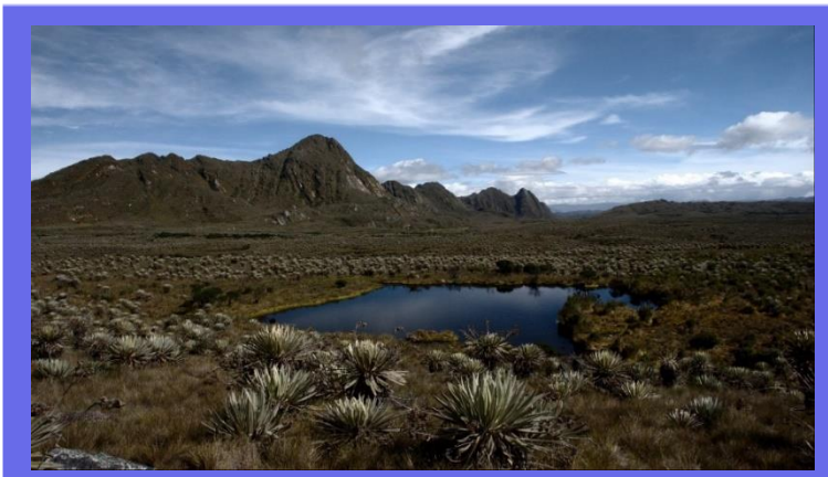
Páramo de Sumapaz https://es.wikipedia.org/wiki/Sumapaz_(Bogotá)