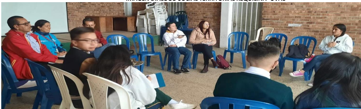
Elaboración propia SLIS Usme Sumapaz