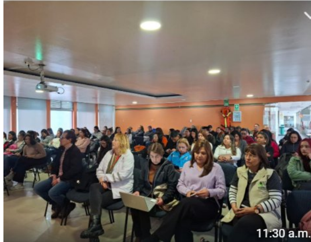
Foto módulo de formación Escuela distrital para la prevención de la ESCNNA