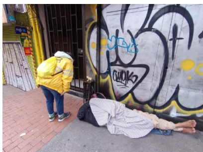
Imagen No. 3