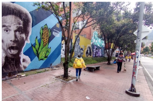
Imagen No. 2