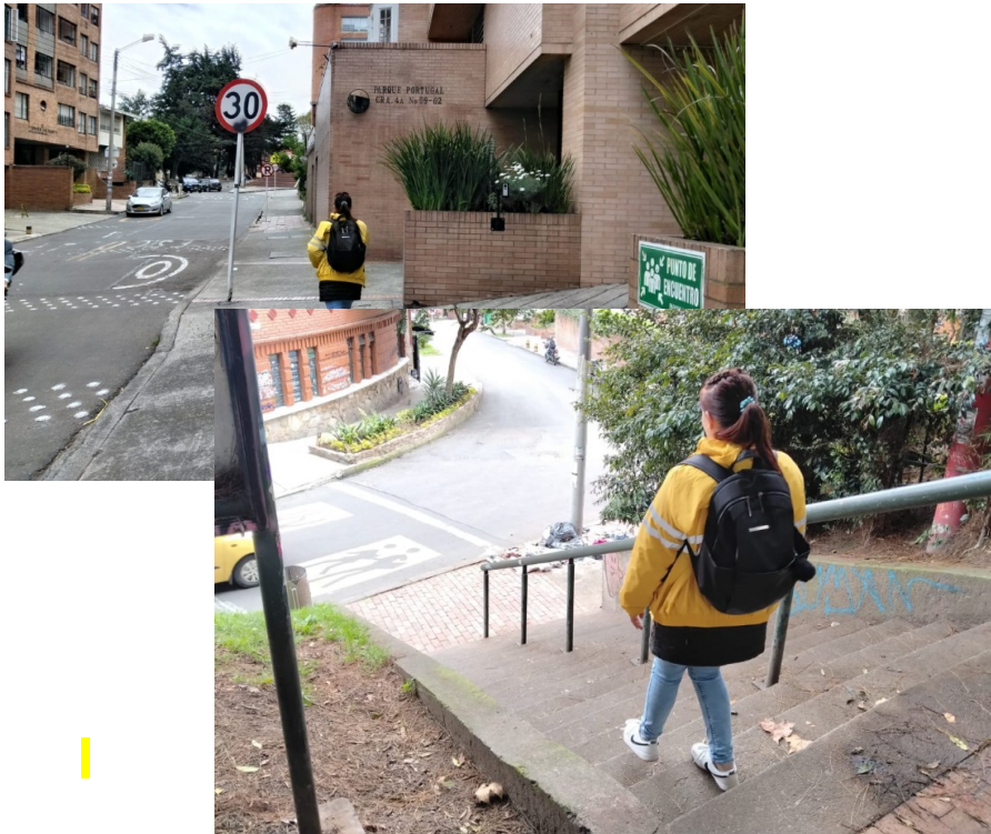
Imagen No. 2

Sede Principal: Carrera 7 # 32 -12 / Ciudadela San Martín Secretaría Distrital de Integración Social Teléfono: 3 27 97 97 www.integracionsocial.gov.co Buzón de radicación electrónica: integracion@sdis.gov.co Código postal: 110311